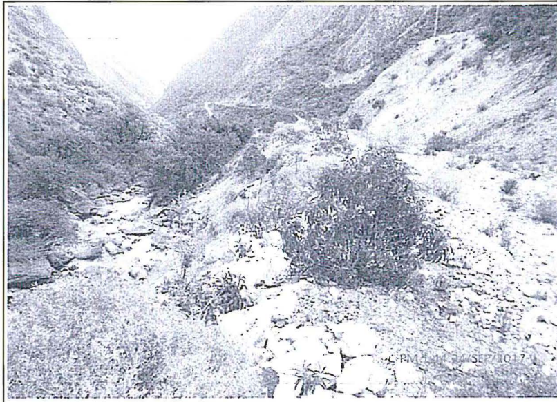
Fotografía N° 3

Descripción: Presencia de vegetación en el talud de la línea de tubería de conducción.