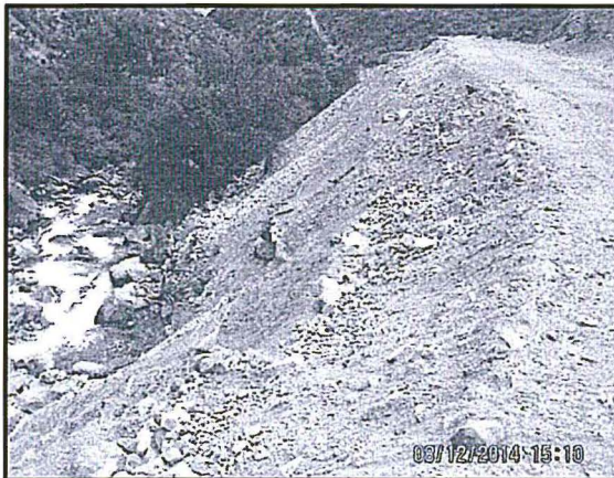
Fotografía N° 4

Descripción: Talud con material excedente suelto, advertido en la Supervisión Regular 2014.