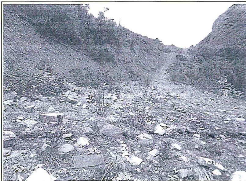
Fotografía N° 4

Descripción: Presencia de vegetación en el talud de la línea de tubería de conducción.