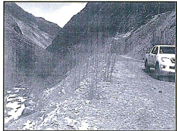
Fotografía N° 5

Descripción: Proceso de plantación de quenuales, no se observa material suelto. Fuente: Levantamiento de observaciones del administrado (junio 2015)