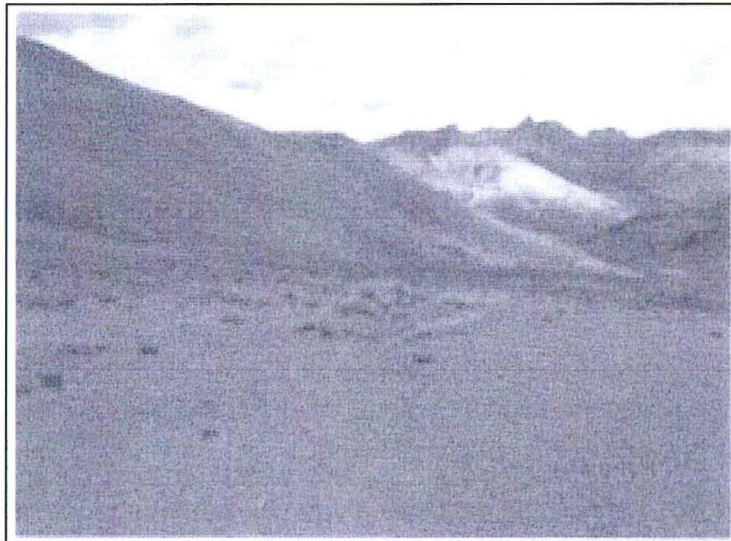
Fotografía N° 2: Se realizó las actividades de cierre de la poza de lodos de la plataforma N° 2, un sondaje de perforación y una poza de lodos (área disturbada), el terreno conformado y nivelado.