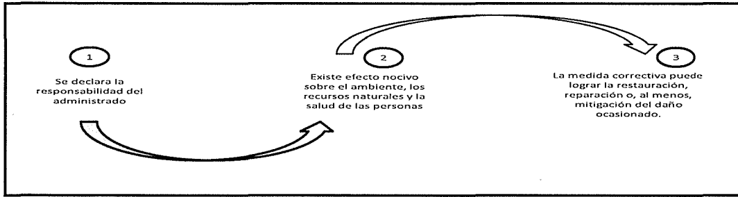
Elaboración: Dirección de Fiscalización, Sanción y Aplicación de Incentivos del OEFA