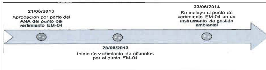
Elaboración: Dirección de Fiscalización, Sanción y Aplicación de Incentivos del OEFA (2017).