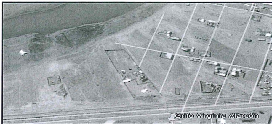
Fuente: Imagen de mapa desplazable (aplicación de mapas Google Earth) Elaboración: Subdirección de Instrucción e Investigación de la Dirección de Fiscalización, Sanción y Aplicación de Incentivos