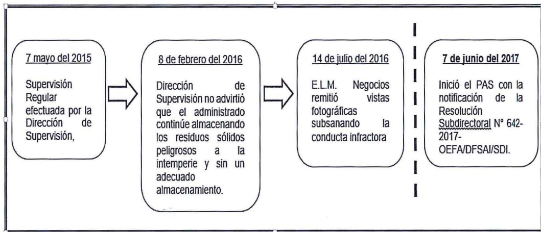
Elaboración: Dirección de Fiscalización, Sanción y Aplicación de Incentivos del OEFA.