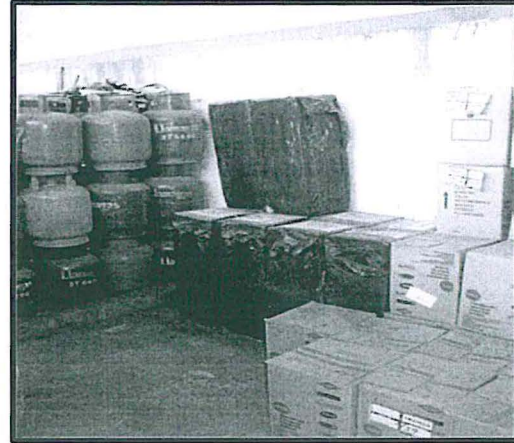
Fotografía N° 18