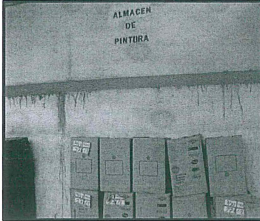
Fotografía N° 17