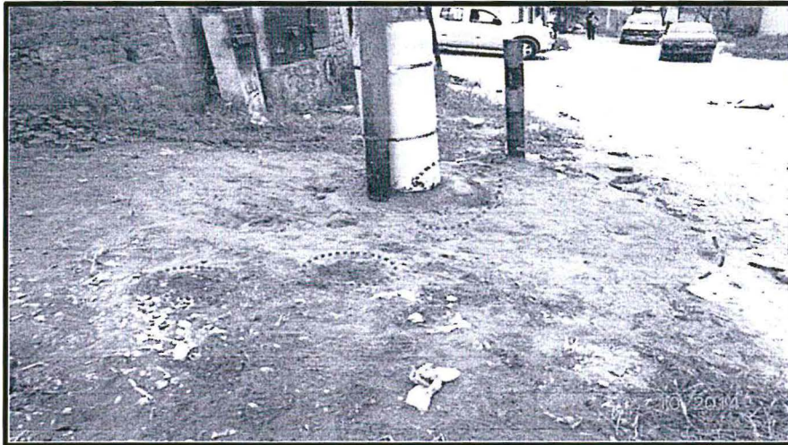
Fotografía N° 3. Zona afectada por aceite dieléctrico, suelo removido por acciones de remediación.