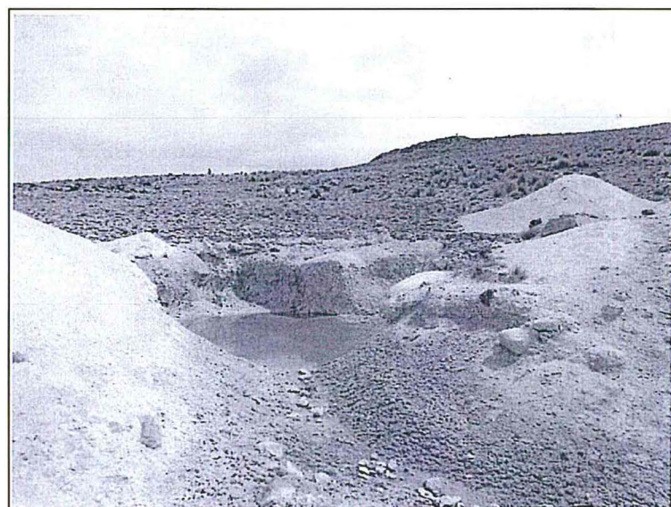
Fotografía N° 013: Área verificada N° 02, se evidencia una poza que capta agua.