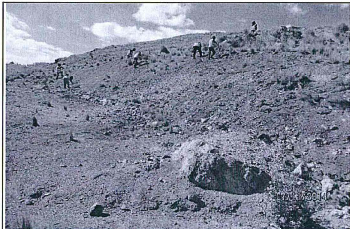
Foto N° 05: Mejoramiento del Perfilado del talud de la plataforma M-31T-2.