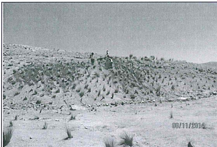
Foto N° 08: Talud de la plataforma M-31T-2 perfilado, adición de capa de suelo orgánico y revegetado.