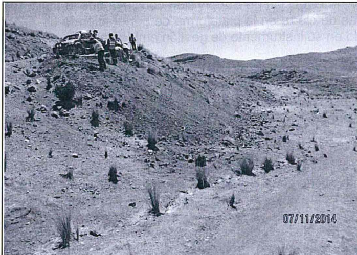
Foto N° 03: Mejoramiento del perfilado en el talud de la plataforma M-31T-2.