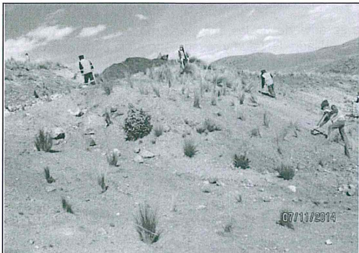
Foto N° 07: Acumulación de suelo orgánico para el talud de la plataforma M-31T-2.