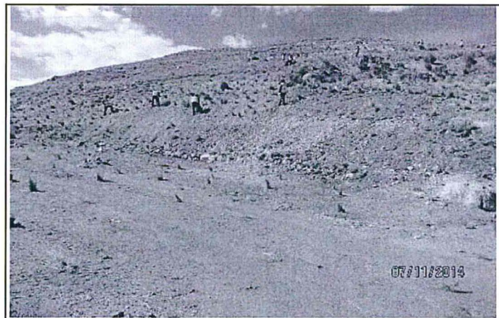
Foto N° 06: Mejoramiento del perfilado del talud de la plataforma M-31T-2.