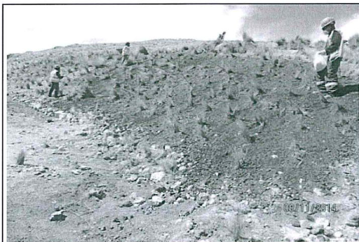
Foto N° 09: Mejoras en el talud de la plataforma M-31T-2, perfilado y revegetado.