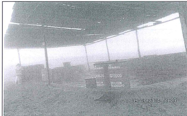
Fotografía N° 44.- Vista del área denominada Aceites y grasas (Zona de almacenamiento central, Residuos sólidos minero-Metalúrgicos) al final de la supervisión, los residuos fueron retirados y el área acondicionada. Falta concluir con reemplazo de las calaminas corroídas del techo.