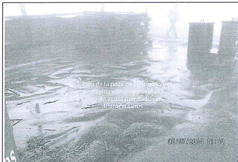
Fotografía N° 45.- Campamento minero - Zona de almacenamiento central, Residuos sólidos minero-Metalúrgicos al final de la supervisión, la poza se encuentra libre de residuos