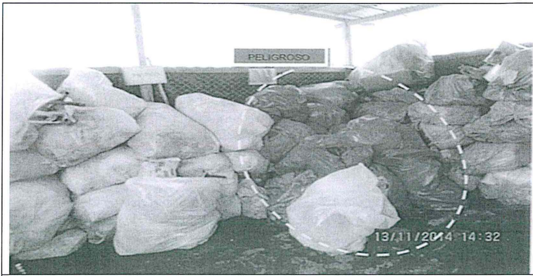
Fotografía N° 58.- Residuos sólidos industriales no peligrosos debidamente clasificados, ensacados y rotulados. Día 13/11/2014 se verificó bolsas de residuos peligrosos en dicho ambiente (Hallazgo N° 2).