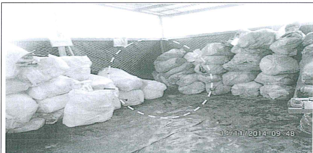
Fotografía N° 59.- Día 14/11/2014 se constató el retiro de residuos sólidos peligroso del área de residuos no peligrosos.