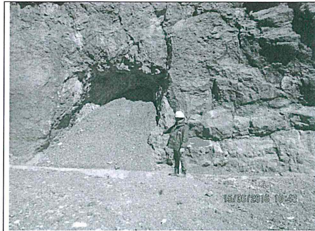
Fotografía de la bocamina nivel 4740

Fotografía N° 12. Bocamina 4740 - Crucero 184 W - Jancapata - Ubicado en las coordenadas Datum WGS84, Zona 18: 313971E, 8830362N, Cota: 4811. La bocamina cuenta con material propio (gravas y arenas) de la zona.