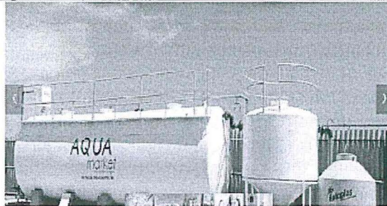
Foto N° 01: Se observa la PTAR instalada en el Lote XIII-A, con una capacidad de 40 m 3 /día