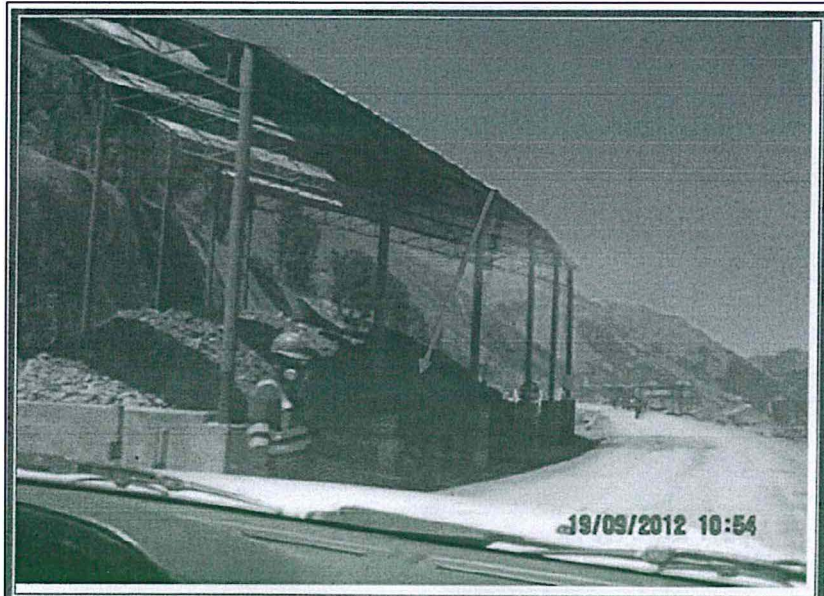
FOTOGRAFIA N° 213.- Se precisa el área donde se encuentra ubicado el stock pile (coordenadas UTM datum WGS 84: Este 0365720, Norte 8712350). Este componente no está contemplado en un instrumento de gestión ambiental que autorice su funcionamiento.