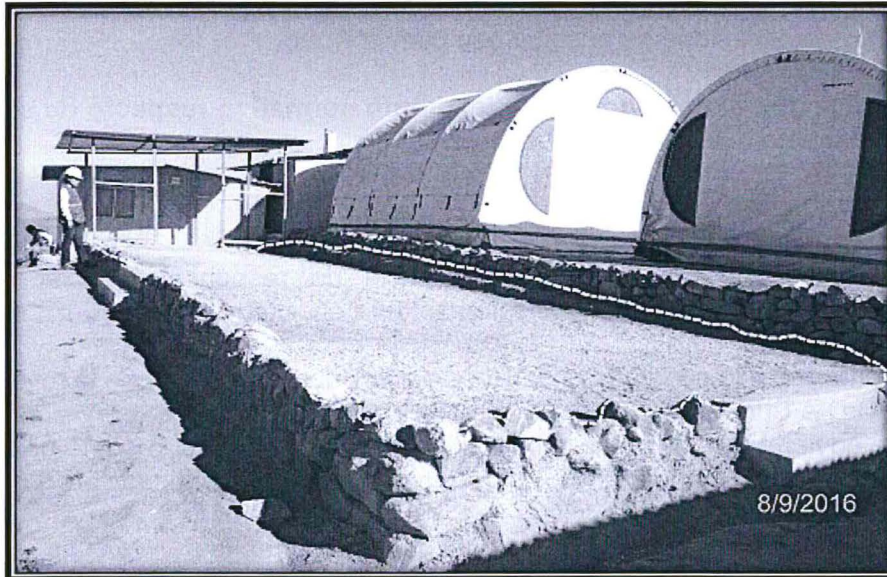
Vista panorámica del área de la Sala de Logueo. Coordenadas (Datum WGS 84 – Zona 18) E: 283197 N: 8760358.