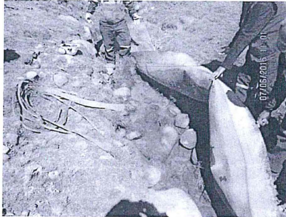
Fotografía N°13. El agua residual de los subdrenajes del depósito de desmontes, vertimiento con código QCH-A discurren por debajo de la geomembrana. Hallazgo N° 1.