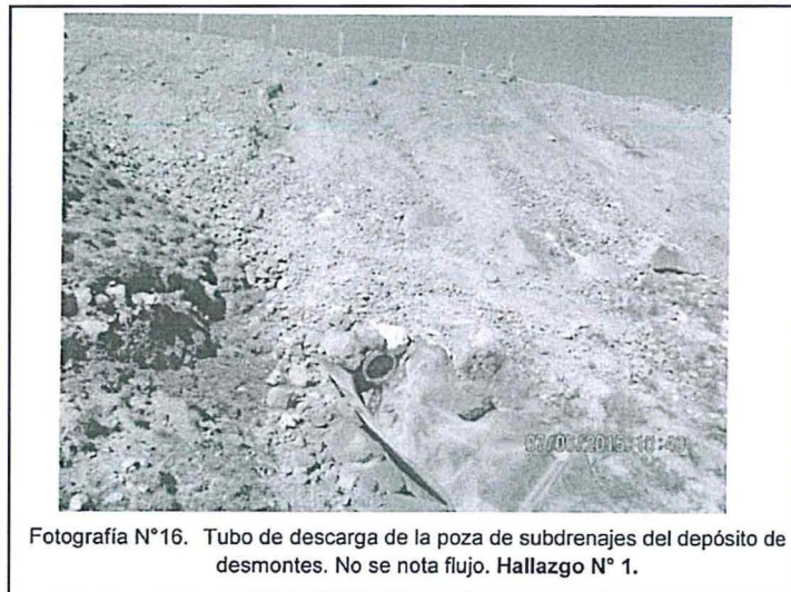
Fotografía N°16. Tubo de descarga de la poza de subdrenajes del depósito de desmontes. No se nota flujo. Hallazgo N° 1.