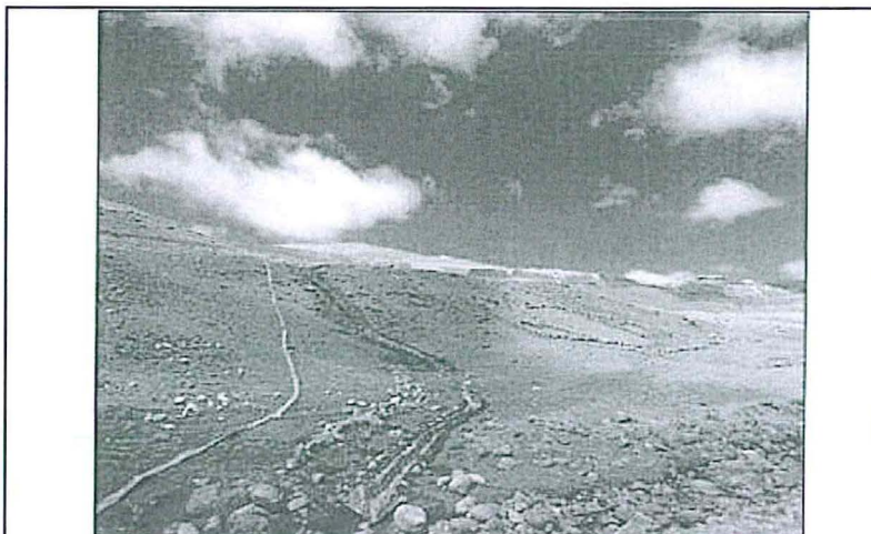
Fotografía N° 02: Se mejoró el anclaje del canal de descarga del vertimiento QCH-A