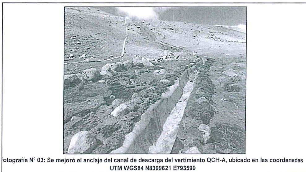
Fotografía N° 03: Se mejoró el anclaje del canal de descarga del vertimiento QCH-A, ubicado en las coordenadas UTM WGS84 N8399621 E793599