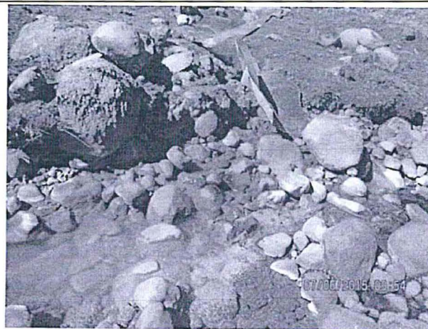
Fotografía N°3. Vertimiento de agua residual proveniente del depósito de desmontes, con código QCH-A. Con un pH de 4.73 y un caudal de 0.012 L/s, al cauce de agua de la quebrada Chonta, cuyo pH aguas arriba es de 6.9 y aguas abajo luego del vertimiento, es de 6.69 Hallazgo N° 1.