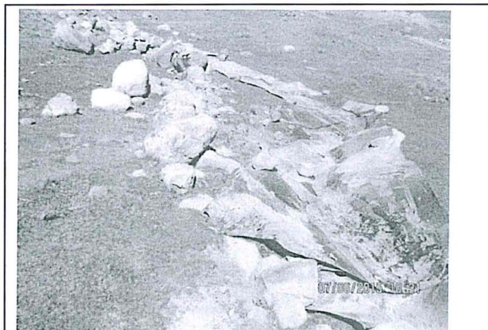
Fotografía N°9. El agua residual discurre por debajo de la geomembrana proveniente del depósito de desmontes, con código QCH-A. Hallazgo N° 1.