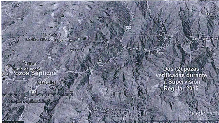
Imagen N° 1: Vista de la distancia entre los Tanques Sépticos contemplados en los Instrumentos de Gestión Ambiental y la poza descrita en el hallazgo N°6-2015, aproximadamente 20 Km.