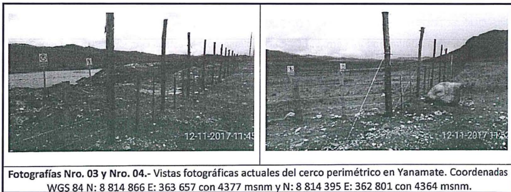
Imagen N° 1 Cerco perimétrico