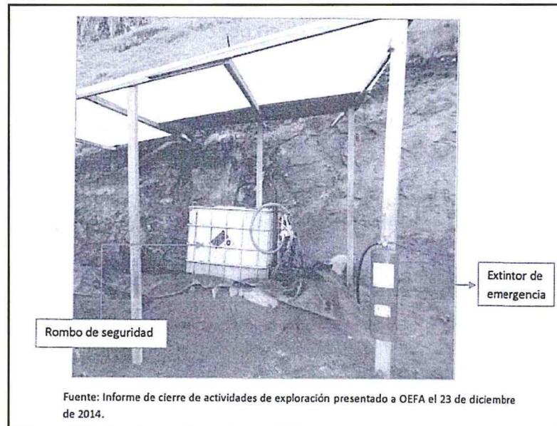
Imagen 6: Medidas de seguridad