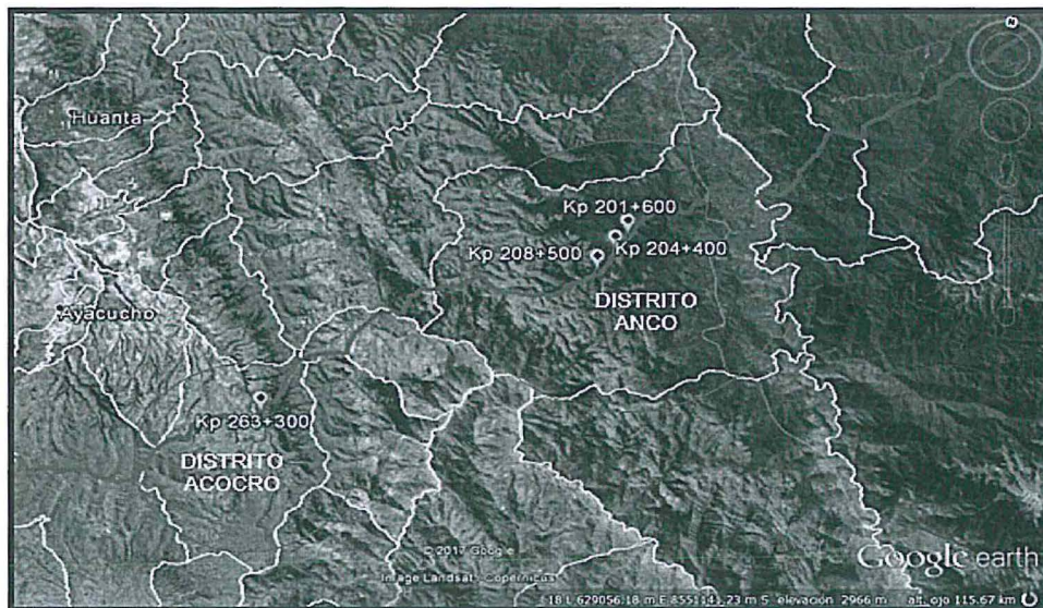
Gráfico N° 1: Ubicación de las progresivas materia de los hallazgos en la acción de supervisión

Elaboración: Dirección de Fiscalización, Sanción y Aplicación de Incentivos del OEFA