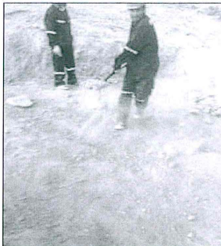
Fotografía N° 3: Retiro de la placa de identificación del sondaje y plataforma.