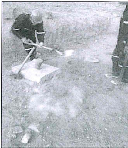
Imagen N° 2: Plataforma N° 5

titular minero realizó medidas correctivas, al retirar los restos de concreto de las Plataformas N° 5 y 6, como se observa en las siguientes fotografías 25 :