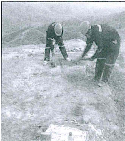
Imagen N° 3: Plataforma N° 6