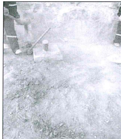
Fotografía N° 3: Retiro de la placa de identificación del sondaje y plataforma.