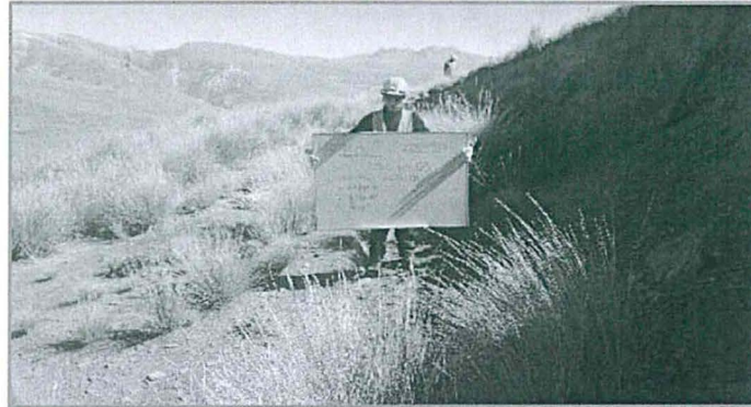
Fotografía N° 1 Antes de las actividades de cierre y rehabilitación en la Plataforma N°3.