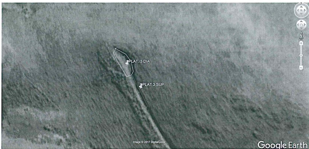
Imagen N° 1: Ubicación de la plataforma N° 3