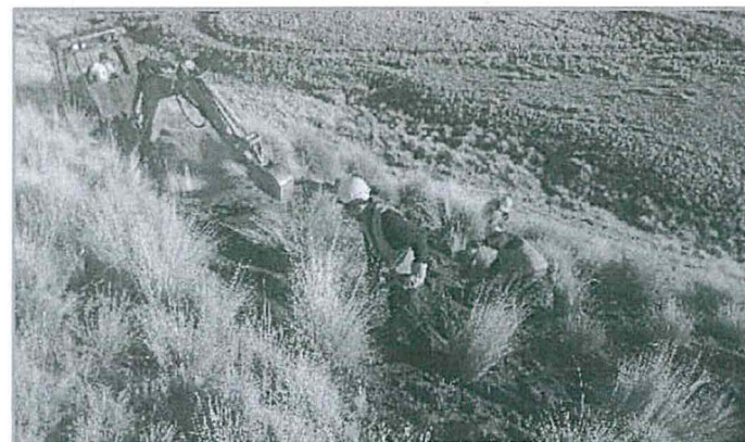
Fotografía N° 3 Abonado y revegetación de la Plataforma N° 3.