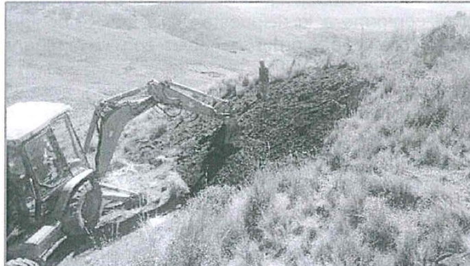
Fotografía N° 2 Perfilado de la Plataforma N° 3.