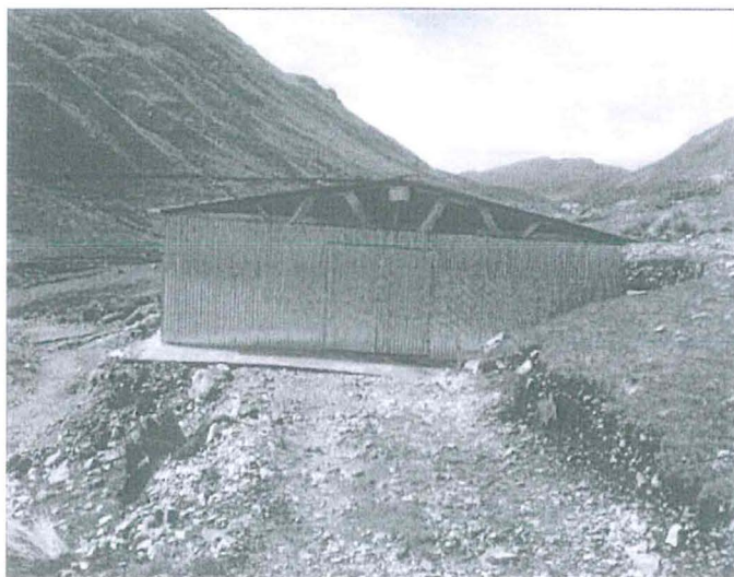
Foto 03: Almacén de residuos sólidos del proyecto.