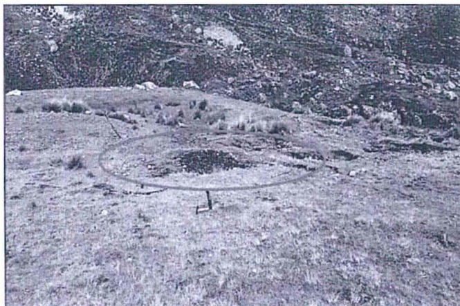
Foto 01: Vista de poza cerrada, ubicada en las coordenadas UTM WGS 84 N 8 438 913, E 721 079

43. El titular minero señala en su escrito de descargos que ha cumplido con: (i) reubicar los residuos verificados al interior de la poza, y a (ii) remediar la poza, como se aprecia a continuación 46 :