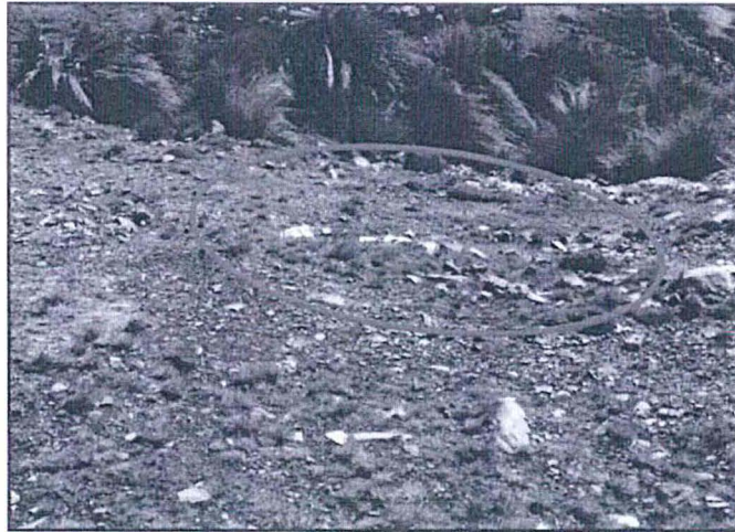
Foto 06: Vista del área remediada, situación actual. No se cuenta con fotos del año 2014.