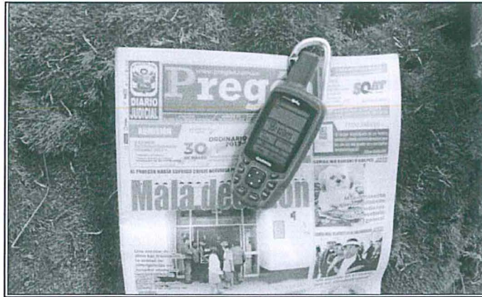
Foto 03: Fecha y coordenadas de las tomas actuales.