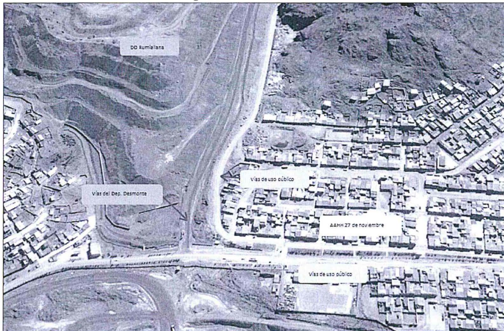
Imagen satelital de las vías