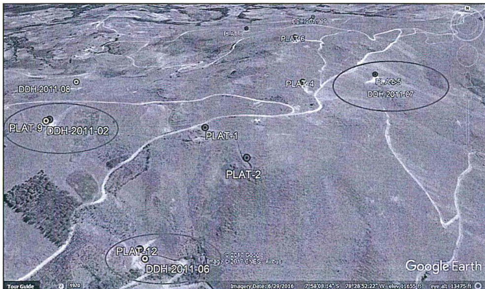
Elaborado por la Dirección de Fiscalización, Sanción y Aplicación de Incentivos