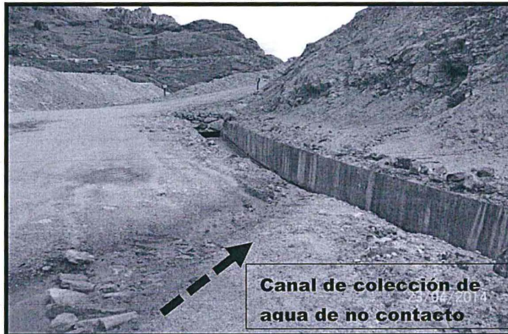
Fotografía N° 50.- Se observa un canal sobre suelo que deriva las aguas provenientes de la cancha de relave N° 4 y 5 hacia el canal de colección de agua de no contacto. Coordenadas WGS84 N 8568570, E 521054.