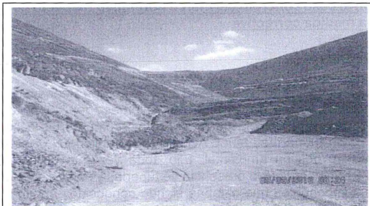
El área se encuentra compactada como parte de los trabajos de conformación de banquetas según plan de cierre. No existen tuberías que estarían descargando agua de la cancha N° 4 y 5. Como parte del cierre del componente se retiró tubería en desuso de aproximadamente 9 metros.