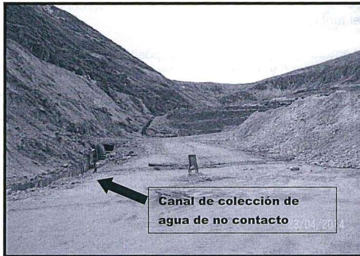
Fotografía N° 48.- Se observa una tubería a través de la cual se estaría descargando agua proveniente de la cancha de relaves N° 4 y 5 hacia el canal de colección de agua de no contacto. Coordenadas WGS84 N 8568570, E521054.