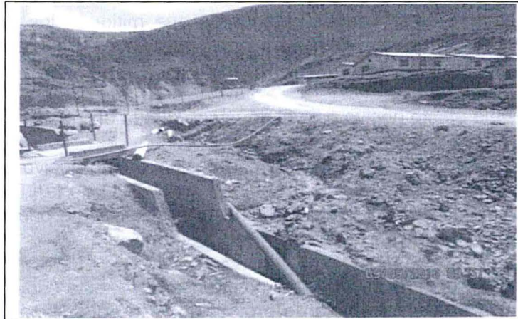
Cancha de desmonte cerrado.- Mediante las tuberías se descarga agua de escorrentía con el fin de evitar erosión en la parte del suelo natural. La tubería conduce agua de no contacto de campamentos obreros, empleados y canal interno de componente cerrado.