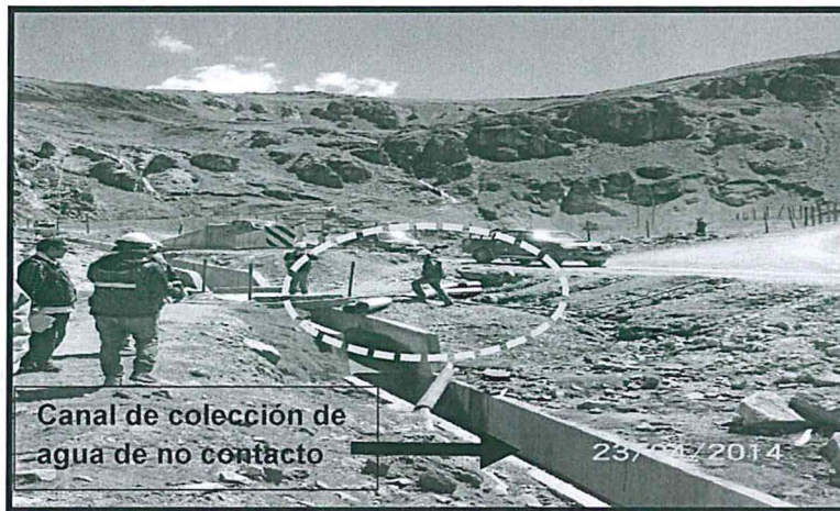
Fotografía N° 20.- Se observa una tubería a través de la cual se estaría descargando agua proveniente de los canales internos y perimetrales del depósito de desmonte remediado hacia el canal de colección de agua de no contacto. Coordenadas WGS 84 N 8569480, E 520937.