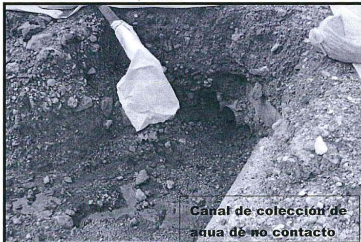
Fotografía N° 57.- Se observa tuberías a través de las cuales se descargan aguas provenientes de la escombrera nivel 420 - 490 hacia el canal de colección de agua de no contacto. Coordenadas WGS84 N 8568347, E521051.