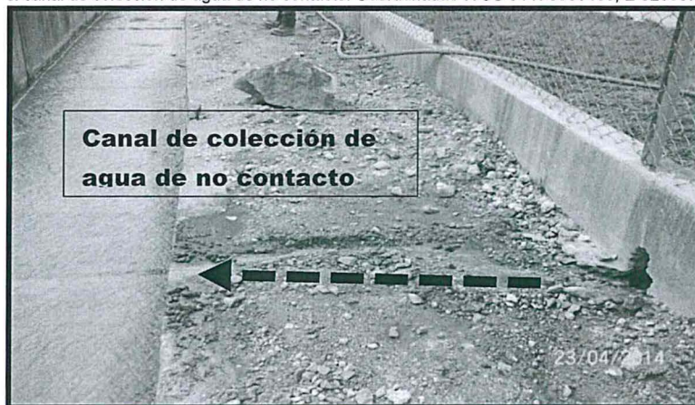
Fotografía N° 45.- Se observa una descarga de agua proveniente de la planta de tratamiento de aguas residuales hacia el canal de colección de agua de no contacto. Coordenadas WGS84 N 8568782, E 52011.