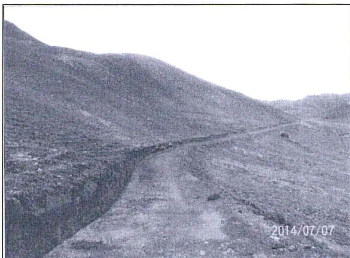
Foto n° 02: Cunetas habilitadas camino hacia la laguna Saywacocha