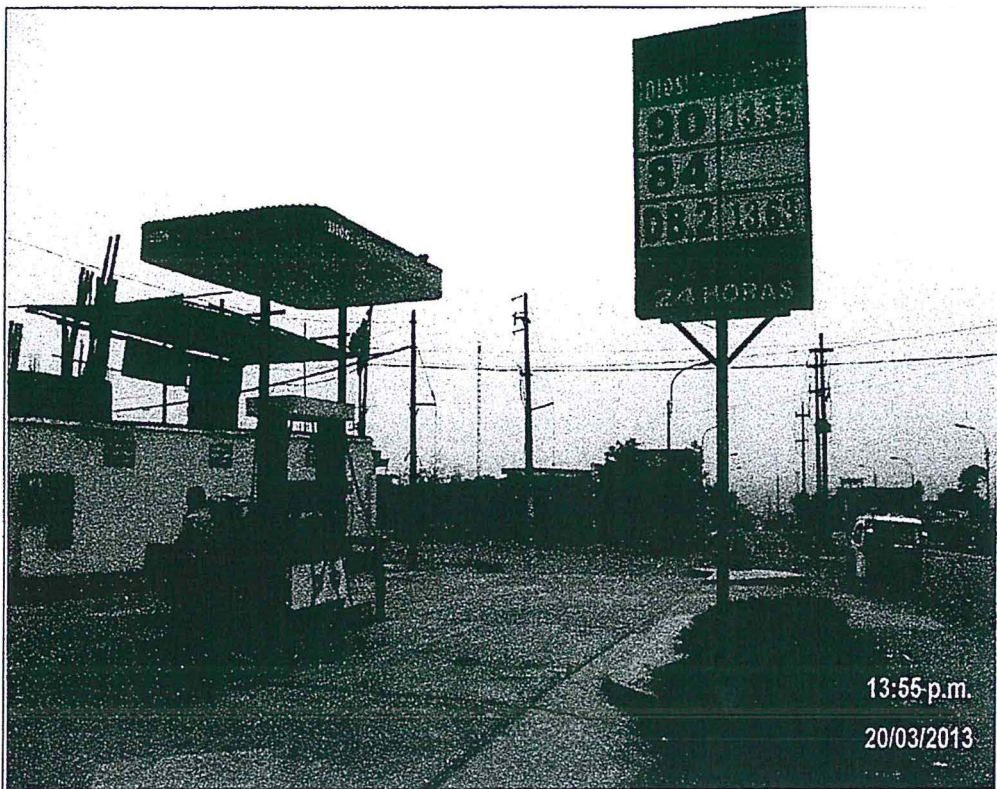
Fotografía N° 1. Vista panorámica del grifo Inversiones Rigar S.A.C. de venta de combustibles líquidos, ubicado en Av. Manuel Prado N° 816 - distrito de Carabaylo, provincia y departamento de Lima.