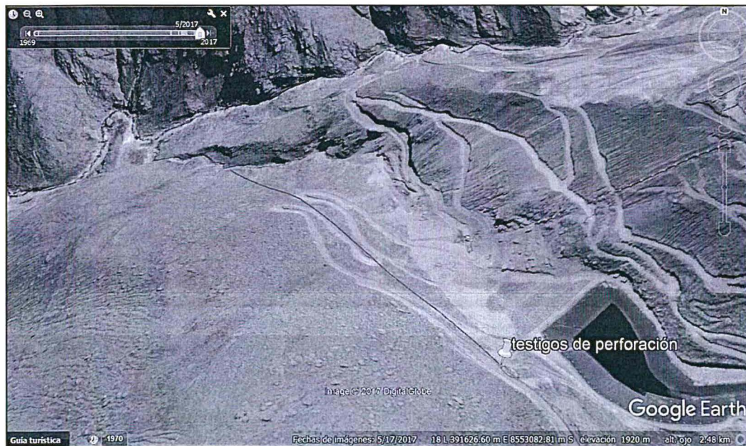
Elaboración: Dirección de Fiscalización, Sanción y Aplicación de Incentivos.