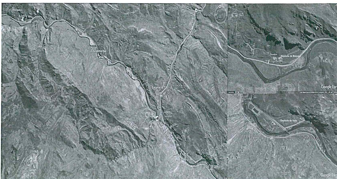
Elaboración: Dirección de Supervisión y Fiscalización del OEFA

39. Del Grafico N° 1, se evidencia que los puntos de control denominados E-101 y E-103, se encuentran ubicados aguas arriba de los depósitos de trióxido de Arsénico de Malpaso y Vado, respectivamente, y los puntos de control denominados E-102 y E-104, se encuentran ubicados aguas abajo de los mencionados depósitos. En ese sentido, debemos señalar que si bien los resultados de los monitoreos realizados en dichos puntos de control, no exceden el parámetro arsénico total; ello se debería a que el flujo de agua que proviene aguas arriba de los depósitos de trióxido de arsénico de Malpaso y Vado, debido a su carga natural y antrópica, mantienen una calidad conforme a la normativa ambiental; además, el caudal de dicho río en época de avenida, por dilución puede favorecer a la disminución de la concentración de Arsénico.