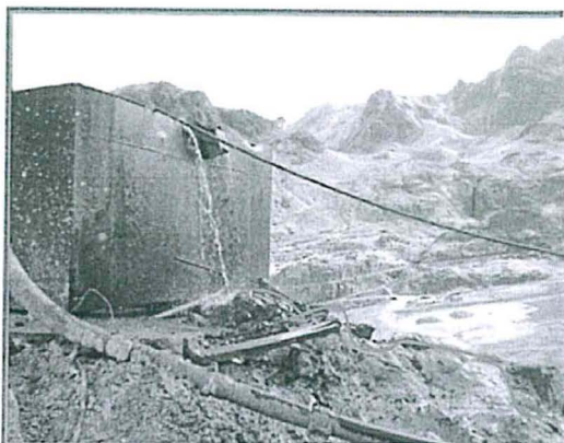
FOTOGRAFIA N° 65.- Faltas de control de alimentación de agua al tanque de la bocamina "Recuay Alto" el agua penetra en el desmonte y erosiona acarreado material hacia terreno de pastos naturales.