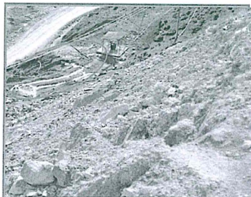
FOTOGRAFIA N° 66.- Se observa el agua de rebose del tanque en contacto con pastos ingresando a la cuneta de la vía.