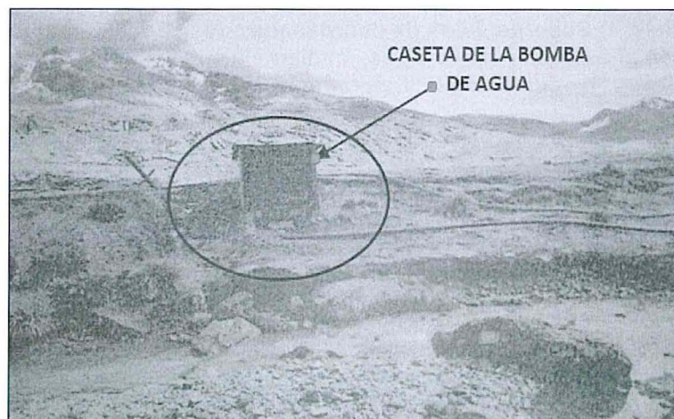
Fotografía N° 1: Antigua caseta de la bomba que abastecía el tanque metálico de la etapa de prueba para el abastecimiento de agua de mina.