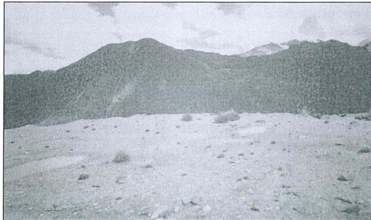
Fotografía N° 2: Estado actual de la zona donde se encontraba el tanque metálico de la etapa de prueba para el abastecimiento de agua de mina.