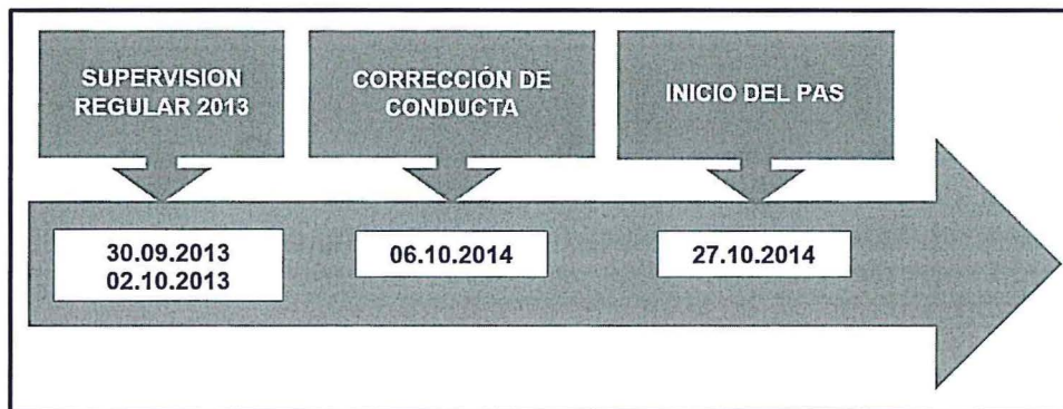
Grafico N° 2: Línea de Tiempo

Fuente: Documentos obrantes en el Expediente N° 1115-2014-OEFA/DFSAI/PAS Elaboración: Dirección de Fiscalización Sanción y Aplicación de incentivos - DFSAI