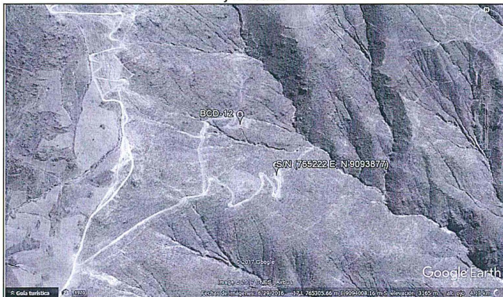
Gráfico N° 2: Imagen Satelital – Ubicación de la plataforma de perforación BDC-12 y la plataforma de perforación sin código ubicada en las coordenadas UTM WGS 84 N: 9 093877 y E: 765222

Elaboración: Dirección de Fiscalización, Sanción y Aplicación de Incentivos del OEFA