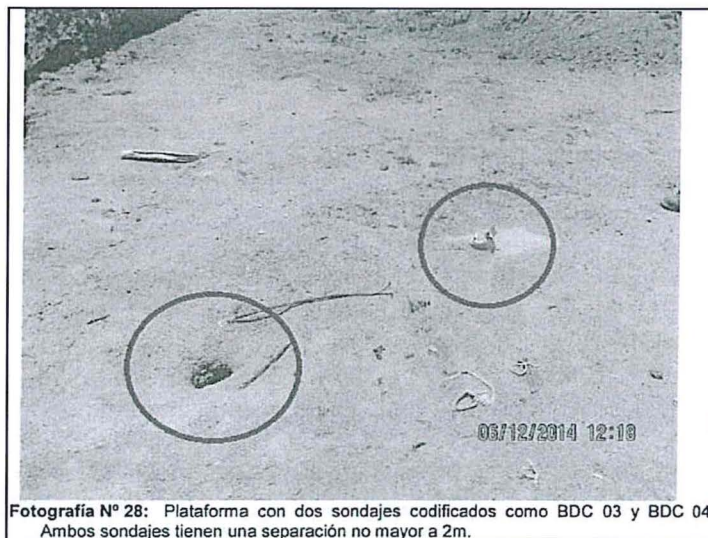
Fotografía N° 28: Plataforma con dos sondajes codificados como BDC 03 y BDC 04. Ambos sondajes tienen una separación no mayor a 2m.

109. En la Resolución Subdirectoral 49 , se concluye que el titular minero habría realizado un sondaje adicional en la plataforma de perforación PLT-1, incumpliendo lo establecido en su instrumento de gestión ambiental.