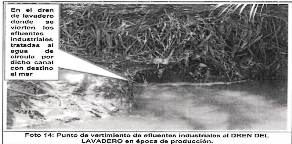
Foto 14: Punto de vertimiento de efluentes industriales al DREN DEL LAVADERO en época de producción.

Fuente: Informe Preliminar de Supervisión