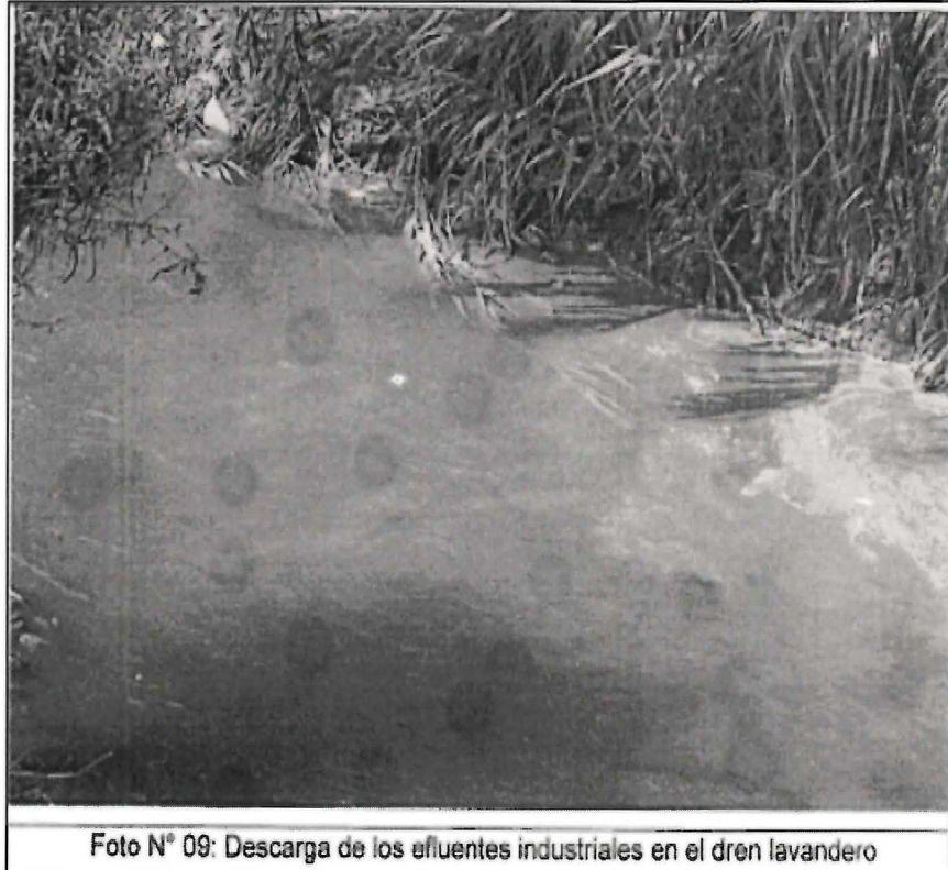
Foto N° 09: Descarga de los efluentes industriales en el dren lavadero