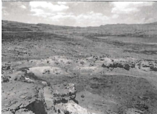
Fotografía N° 20. Área colindante a la Laguna Yanamate. Se observó pérdida de cobertura vegetal entre el nivel del espejo actual del agua y el nivel máximo de inundación de la Laguna Yanamate, observándose también presencia de sedimentos.