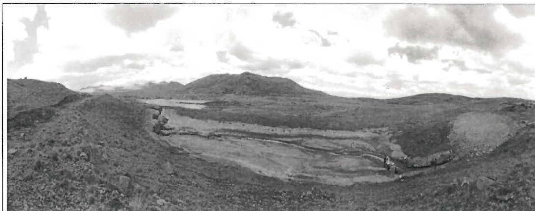
Fotografía N° 32. Vista panorámica del recorrido desde el tramo final de la tubería que conduce agua proveniente de la unidad fiscalizable Cerro de Pasco hacia la Laguna Yanamate. En la parte superior donde se estacionaron las camionetas se ubica el tramo final de la tubería en mención, en la parte baja se encontró un área cubierta con enrocado y gravas en la cual se observó dos tipos de materiales de diferentes colores. A continuación, se observó un canal excavado sobre el terreno sobre el cual se observó remanente de agua conduciéndose a través de dicho canal que en un tramo se vuelve subterráneo y termina en la parte baja cerca al nivel actual de la laguna Yanamate.