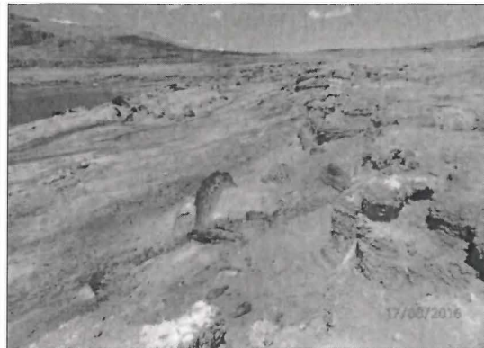
Fotografía N° 22. Área colindante a la Laguna Yanamate. Se observó pérdida de cobertura vegetal entre el nivel del espejo actual del agua y el nivel máximo de inundación de la Laguna Yanamate. Asimismo, se observa dos tipos de coloración (gris y naranja) sobre el terreno.