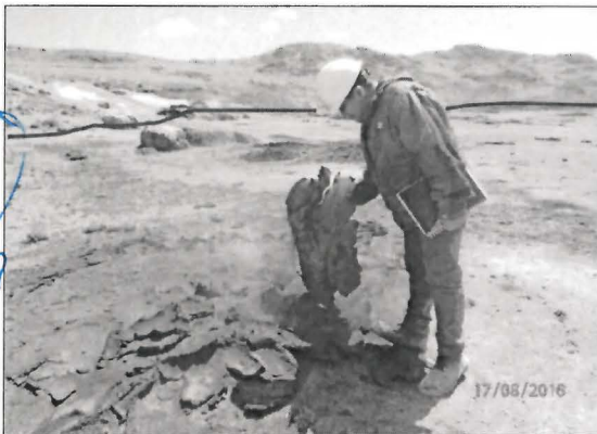
Fotografía N° 23. Durante la supervisión se delimitó una línea de afectación que coincidiría con el nivel máximo de inundación de la Laguna Yanamate. En la zona de afectación se observó cobertura vegetal dispersa y material orgánico descompuesto.