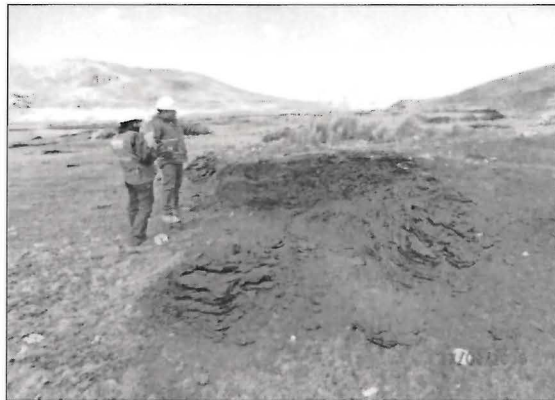
Fotografía N° 24. Los surcos del material orgánico indican que el nivel de agua de la Laguna Yanamate habrían llegado hasta ese lugar por el cual se delimita la línea de afectación.