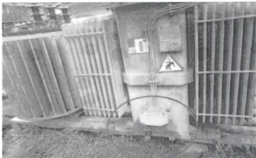
Fotografía 2. Se observa que la válvula de aceite de uno de los transformadores de 750 kVA se encontraba impregnada con aceite dieléctico.