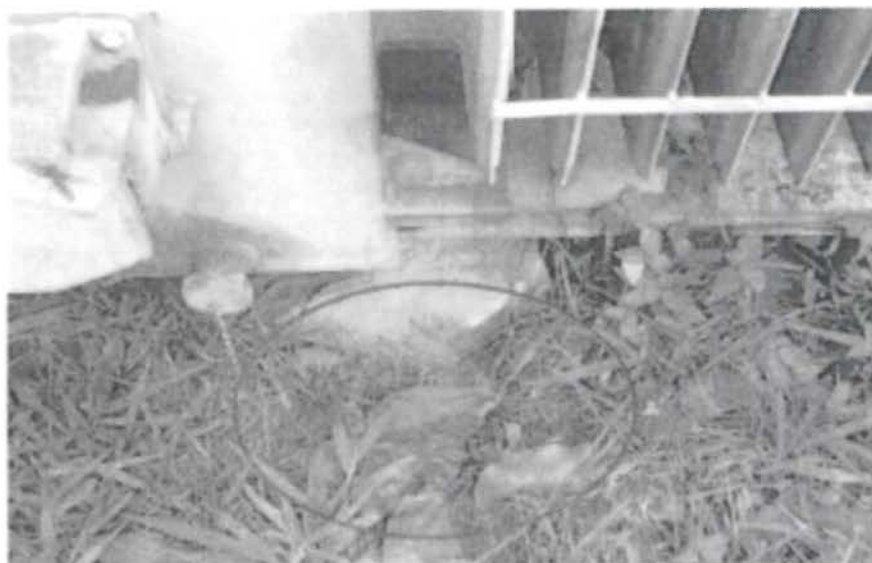
Fotografía 3. Se observa el derrame de aceite dialéctico de uno de los transformadores hacia el suelo natural.