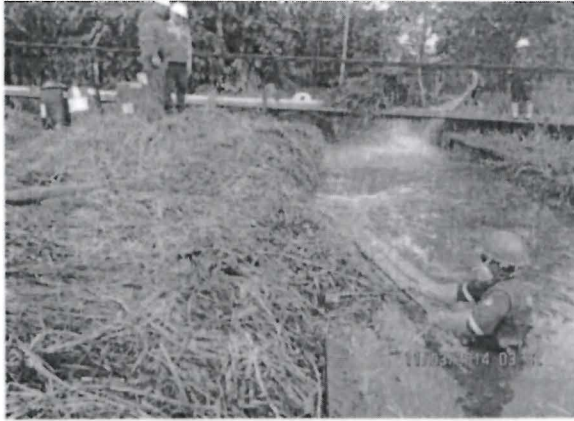
Foto N° 3. Actividades de limpieza del agua del canal. lavado de las riveras y recuperación del hidrocarburo derramado en la fuente de agua