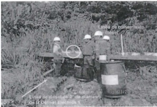
Foto N° 1. Vista del cruce de válvulas de la línea de transmisión de diésel de la Central Eléctrica 1 a la Central Eléctrica 2.