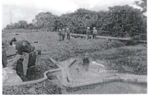
Foto N° 6. Personal de contingencia desarrollando actividades de recuperación del diésel sobrenadante utilizando el Skimmer (color rojo señalado), también puede verse la barrera de contención instalada y la extensión de suelo impactado