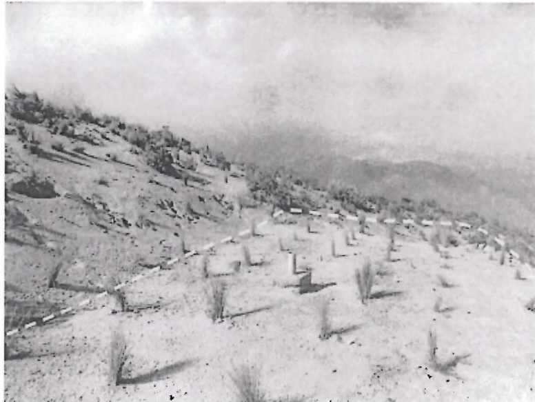
Fotografía N° 19. Vista de la plataforma B1 que no se encuentra nivelada.

Anexo 10 del Informe Preliminar, tal como se muestra a continuación 51 :