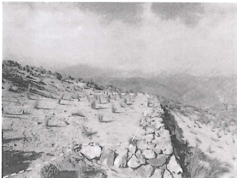
Fotografía N° 21. Otra vista de la plataforma B1 que no se encuentra nivelada