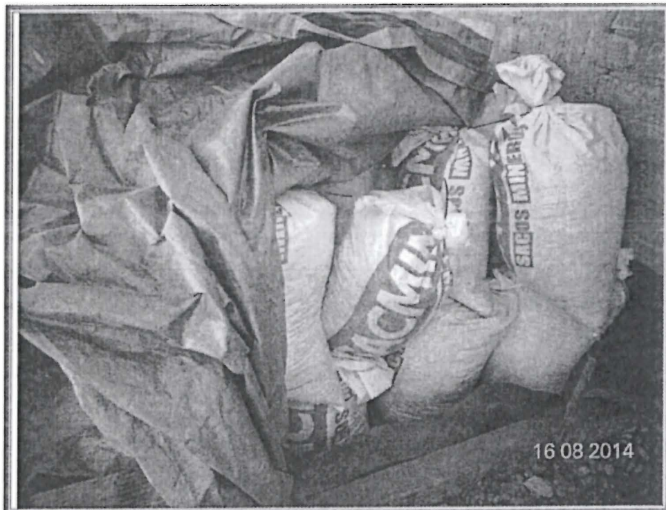
Fotografía N.º 03.- Tierra contaminada en sacos Vista fotográfica de los costales que contienen suelos impregnados con hidrocarburo, previamente removidos de la zona afectada por el titular minero.

De otro lado, Anglo American sostiene como uno de sus alegatos que la DFSAI sobredimensionó los hechos al señalar que se realizó el despliegue de personal y maquinaria. Sin embargo, conforme se advierte en el