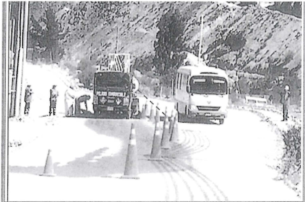
Fotografía N.º 01.- Zona en donde se produjo el derrame de petróleo. Vista fotográfica de los conos de señalización de PVC reflectante.

De los hechos descritos, se advierte que existió un nivel de afectación directa en la actividad del administrado, lo cual generó que se proceda a cerrar parcialmente el acceso principal del campamento Quellaveco, interrumpiéndose el tránsito normal de las unidades de transporte, y que se desplegara personal y recursos logísticos de la administrada, a fin de contener, revertir el derrame y realizar la limpieza del área afectada, conforme se advierte en las siguientes fotografías: