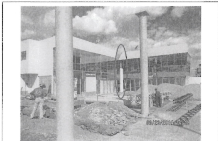
Fotografía N° 3: Vista de la oficina administrativa del Puesto de Venta de Combustibles, se puede notar que el pararrayos había sido quitado.

Handwritten blue ink signatures and scribbles on the left side of the page.