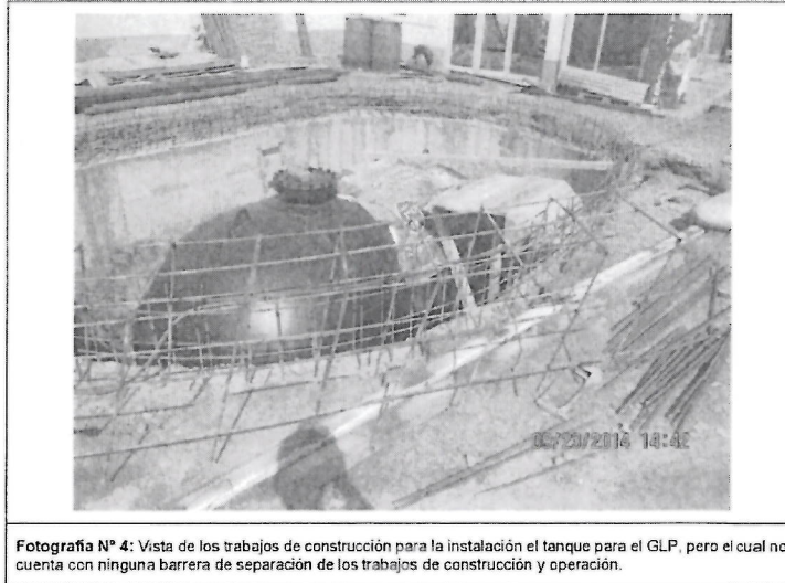
Fotografía N° 4: Vista de los trabajos de construcción para la instalación el tanque para el GLP, pero el cual no cuenta con ninguna barrera de separación de los trabajos de construcción y operación.