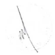
Antonio José Brack Egg MINISTRO DEL AMBIENTE