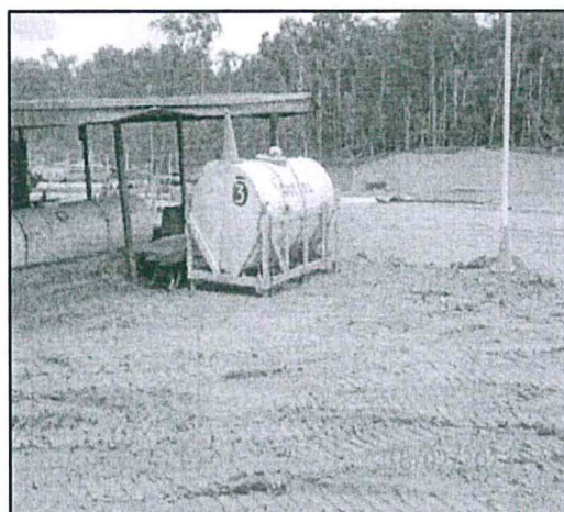
Fotografía N° 7. Tanque metálico de 1000 galones con diésel, no cuenta con bandeja de contención.