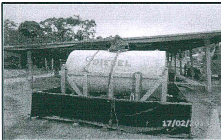
Fotografía de recipiente de combustible dentro de un sistema de contención. Locación San Martín Este