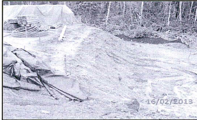
Fotografía N° 9. Erosión incipiente en el almacén de topsoil