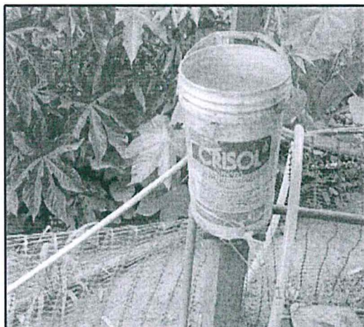
Fotografía N° 3. Envase de plástico con producto químico, sin rótulo ni tapa, en la Planta de Tratamiento de Aguas Residuales Domésticas (PTARD).