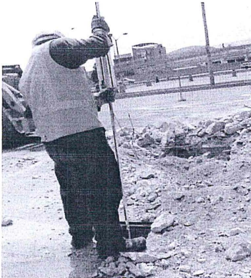
Fotografía N°2: Vista de trabajos en la EESS y Gasocentro PRO.

En la fotografía N° 2 , se observa al operador realizando la verificación de nivel de combustible del tanque.