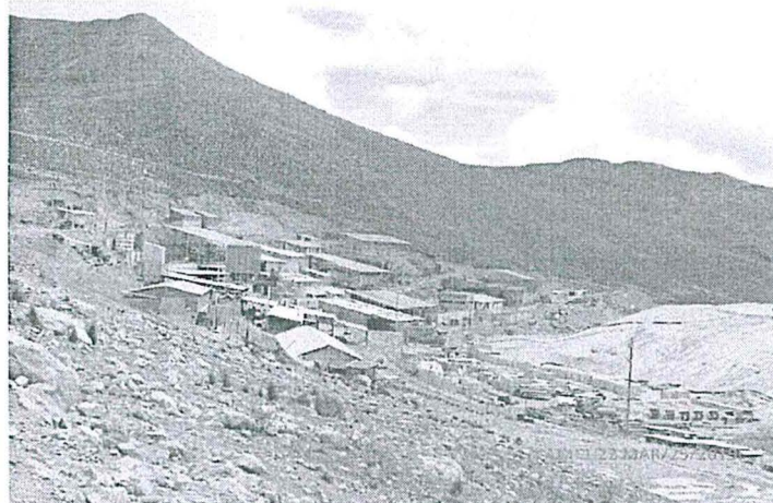
FOTOGRAFÍA N° 7: Vista general de la planta de beneficio Huancapetí.