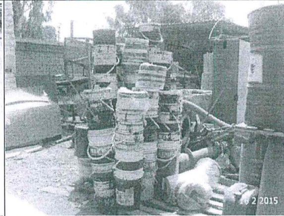
Foto N° 14: Envases en desuso de tintas utilizadas en el proceso de impresión de cajas colocadas a la intemperie,