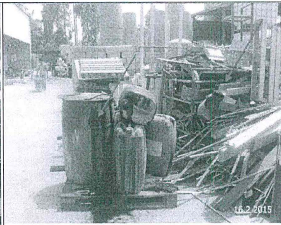
Foto N° 12: Envases en desuso con residuos de aceites usados colocados sobre pallets, expuestos a la intemperie, próximo a residuos metálicos (chatarra).