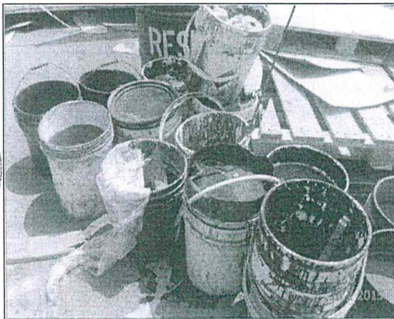
Foto N° 11: Envases plásticos conteniendo aceite residual, colocados sobre el piso de cemento, expuesto a la intemperie.