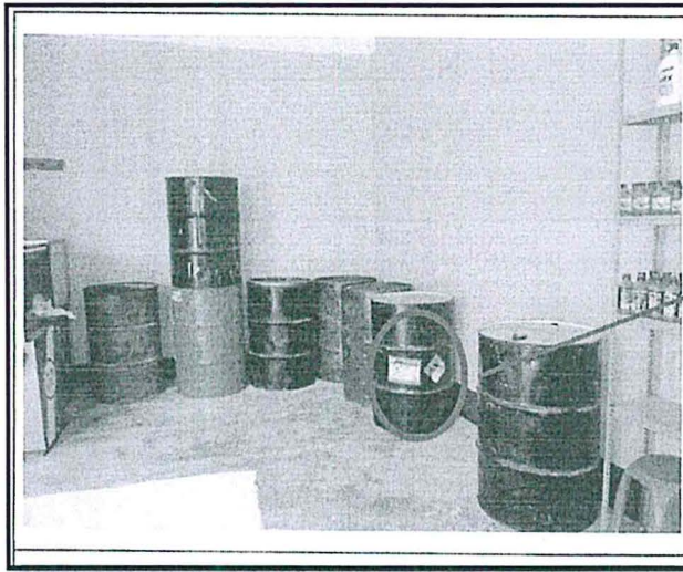
Vista de barriles y recipientes conteniendo sustancias químicas en un almacén sin sistema de doble contención.