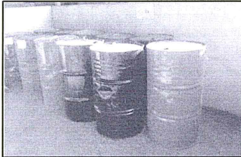
Fotografía N° 1: Donde se aprecia el nuevo almacenamiento de productos químicos (pintura) el cual tiene piso impermeabilizado y muro de doble contención.