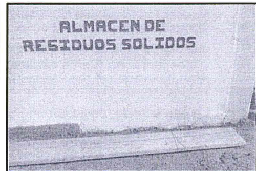
Fotografía N° 4: Donde se aprecia el almacén central de residuos sólidos el cual esta debidamente identificado y cercado.