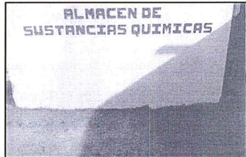
Fotografía N° 2: Donde se ve el frontis del almacén de productos químicos (pinturas) el cual se encuentra debidamente identificado.