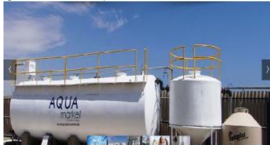
Foto N° 01: Se observa la PTAR instalada en el Lote XIII-A, con una capacidad de 40 m 3 /día