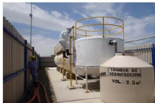
Foto N° 02: Se observa actividades de inspección en la PTAR instalada en el Lote XIII-A