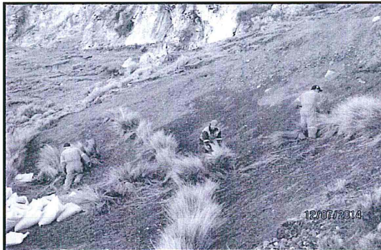
Imagen N°5: Replantado de barreras vivas para el control de erosión hídrica, en forma perpendicular al talud.