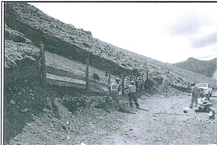
Imagen N°2: Conformación de dique de madera - muro seco al pie del talud para asegurar la estabilidad física.