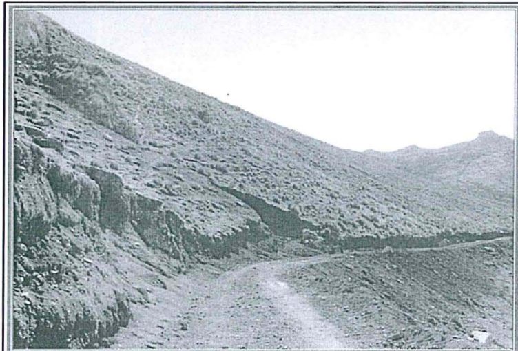
Fotografía N° 84: Se observa personal del titular minero con una carretilla en el área disturbada de la plataforma YU-11. Según la última fecha de modificación digital, la fotografía sería del 12/07/2011.

Handwritten signature or initials in blue ink.