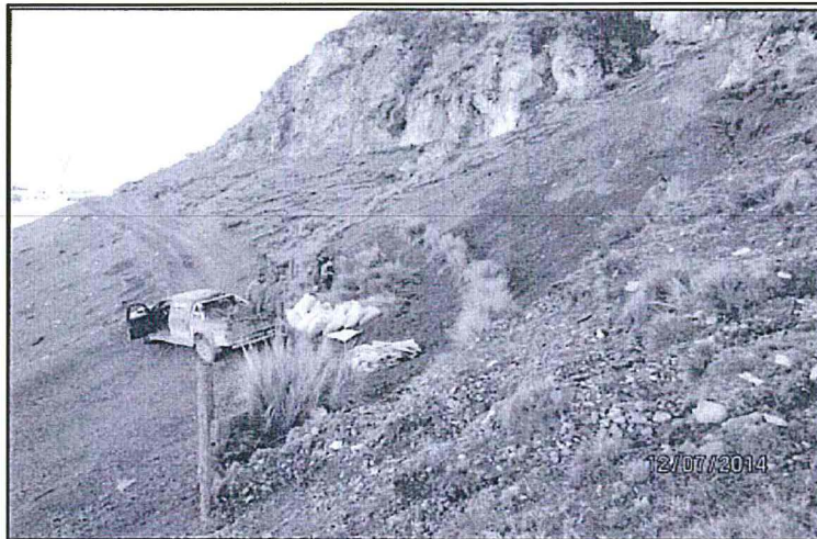
Imagen N°4: Replantado de especies nativas "Ichu" (Stipa ichu)