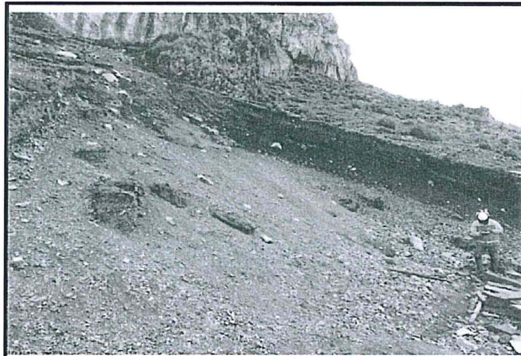
Imagen N°1: Talud de corte erosionado por precipitaciones.