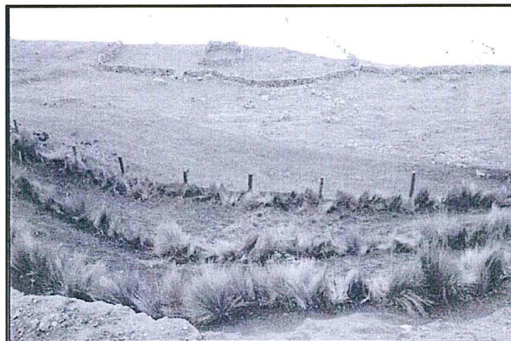
Imagen N°6: Reconformación de la plataforma YU-11.