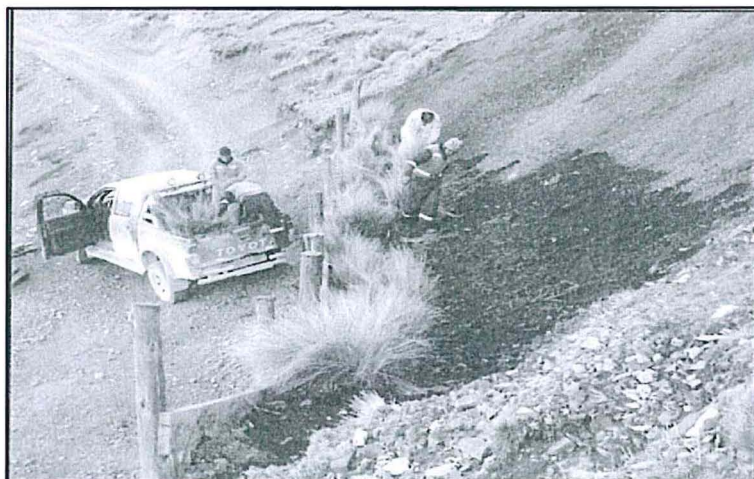
Imagen N°3: Rellenado y recubrimiento de la superficie con suelo orgánico.