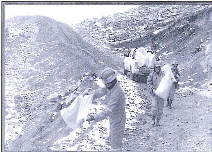
Fotografía N° 86: Se observa personal llevando sacos. Según la última fecha de modificación digital, la fotografía sería del 04/07/2014.